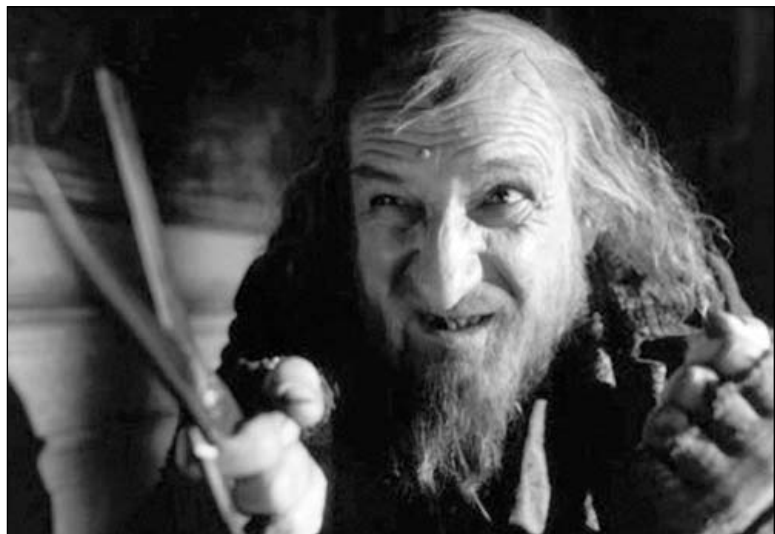
Кадр з кінафільма «Олівер Твіст»

Але творчасць Дзікенса ўспамінаюць далёка не толькі ў музейнай цішыні або ўніверсітэцкіх аўдыторыях. Імя пісь-