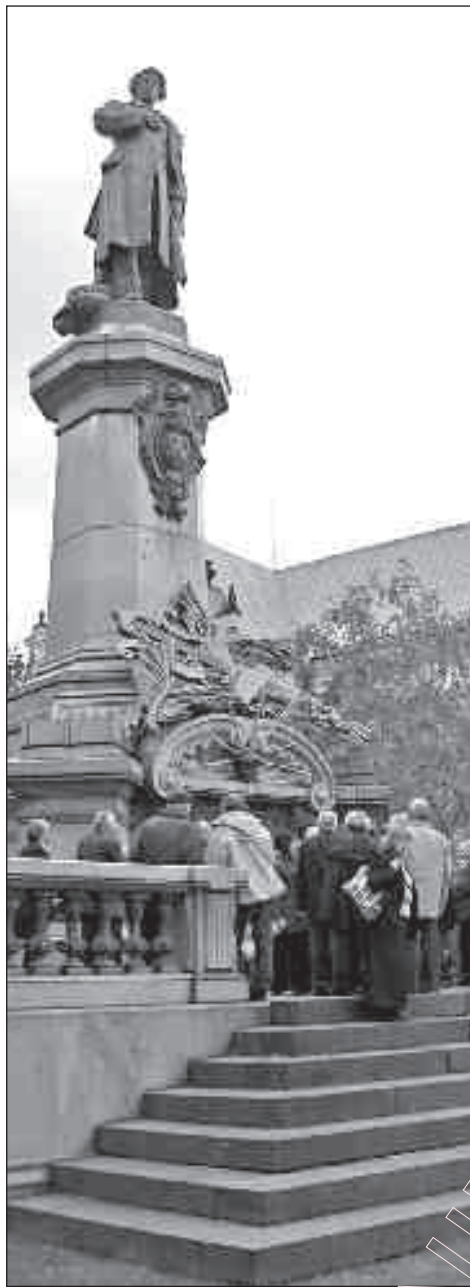
Варшава. Помнік Адаму Міцкевічу.

да сёння праклінаю закон прыцягнення і хоць раней не прызнаваўся бачу часам шэрых папярковых птахаў