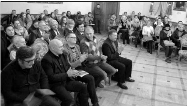
Зала Ратушы.

Нагадаем, раман Алексіевіч «Час Second-Hand» у 2014 і 2015 гадах быў выдадзены ва Украіне ў выдавецтве «Дух і Літэра». «Чарнобыльская малітва» (выдавецтва «Комора») у перакладзе Аксаны Забужка неўзабаве таксама з'явіцца ў крамах.