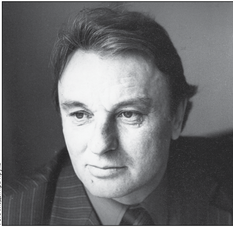
Фота Уладзіміра Крука

І Міхась Лявонавіч нада мной злітаваўся! Нядаўна ў дабраславёным БДАМЛіМе