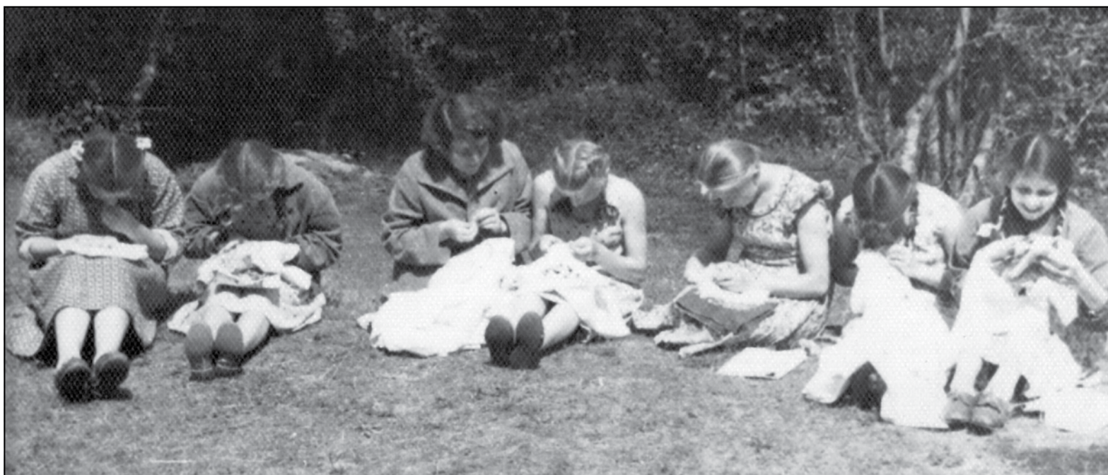
Так іх вучылі вышываць

Выхаванцы былі прыстойна апрануты, пакормлены. Нездаровыя і слабыя атрымлівалі дадатковы паёк. Спалі на матрасах, напханных саломая, у вялікіх пакоях. Усё жыццё сястры сніўся агульны пакой і шарэнгі ложкаў. Кожнае лета дзяўчынку браў да сябе брат бацькі, дзядзька Віця Галінеўскі