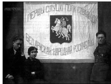
Сцяг Слуцкага збройнага чыну

у баях Слуцкі полк атрымаў высокую ўзнагароду — залацісты сцяг з «Пагоняй», была і заслуга гэтай неразлучнай тройцы.