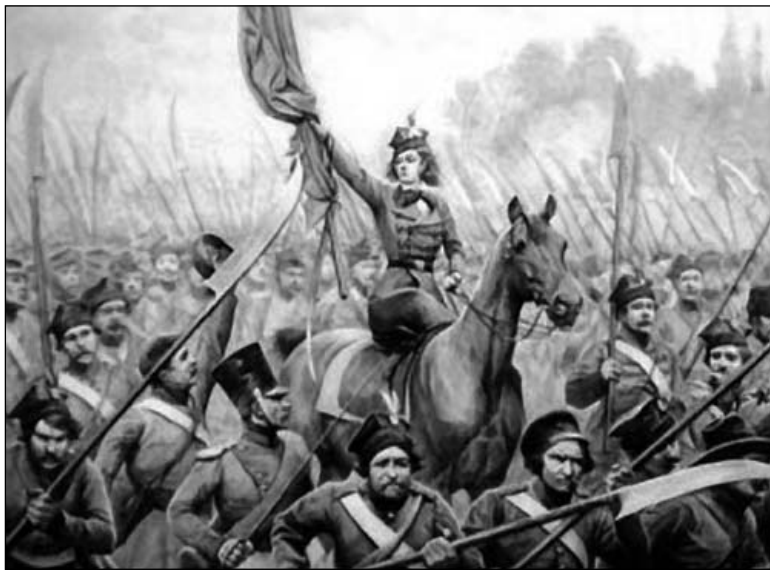
Эмілія Плятэр у сутычцы пад Шаўлямі. 1831 год. Карціна Войцеха Косака