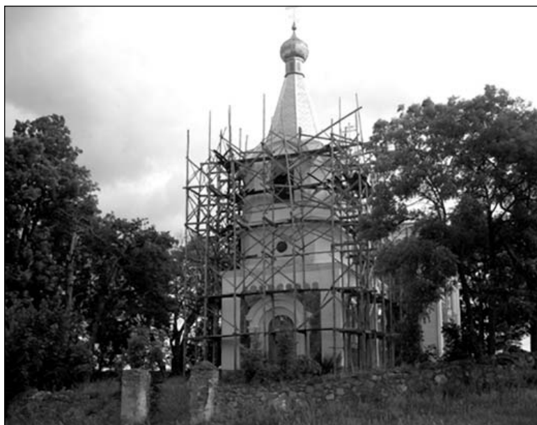
Яшчэ ў 2003 годзе побач з царквой стаяў крыж памяці Валовіча і паўстанцаў. На загад праваслаўнага святара крыж выкапалі і кінулі побач са Шчарай