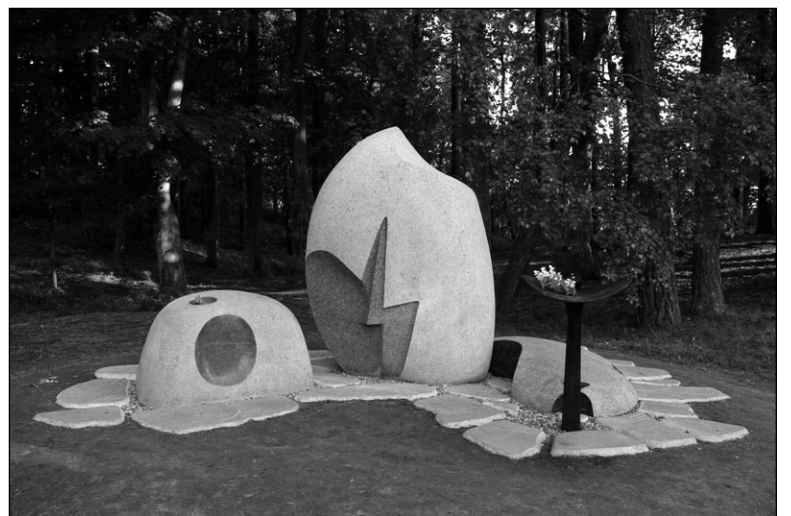
Скульптурная кампазіцыя, пастаўленая ў 2011 г.

ніцы. Абуэрне таксама выклікае непавага да месца перабывання абрадавага агня — і тое, што ранейшы, намолены ўжо ахвярнік узалі і разбурылі, і тое, што на новым «ахвярніку»-лапіку месца для агня шмат меншае. Асабліва важна — наноў месца парадкавалі не дзеля жывога асваення прасторы, як раней, а ў рамках праграмы ўпарадкавання турыстычна значных аб'ектаў (на гэта былі выдзелены сродкі Еўрасаюза).