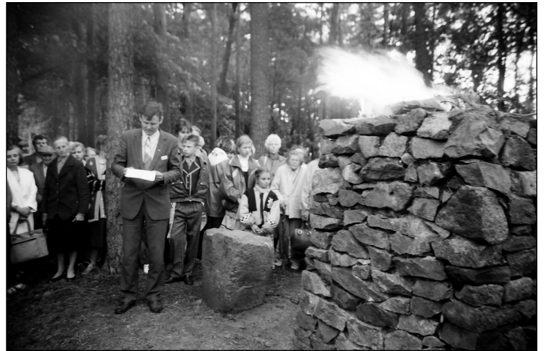
Удзельнікі V з'езда літоўнікаў у 1993 г. ля алтарнага агня.