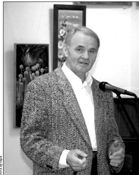
Вядома, што мова — Зямлі дар і Неба. Ахоўнікаў скарбу нам век не стае.

Маліцца за родную мову нам трэба, — О так людзі любяць святыні свае!