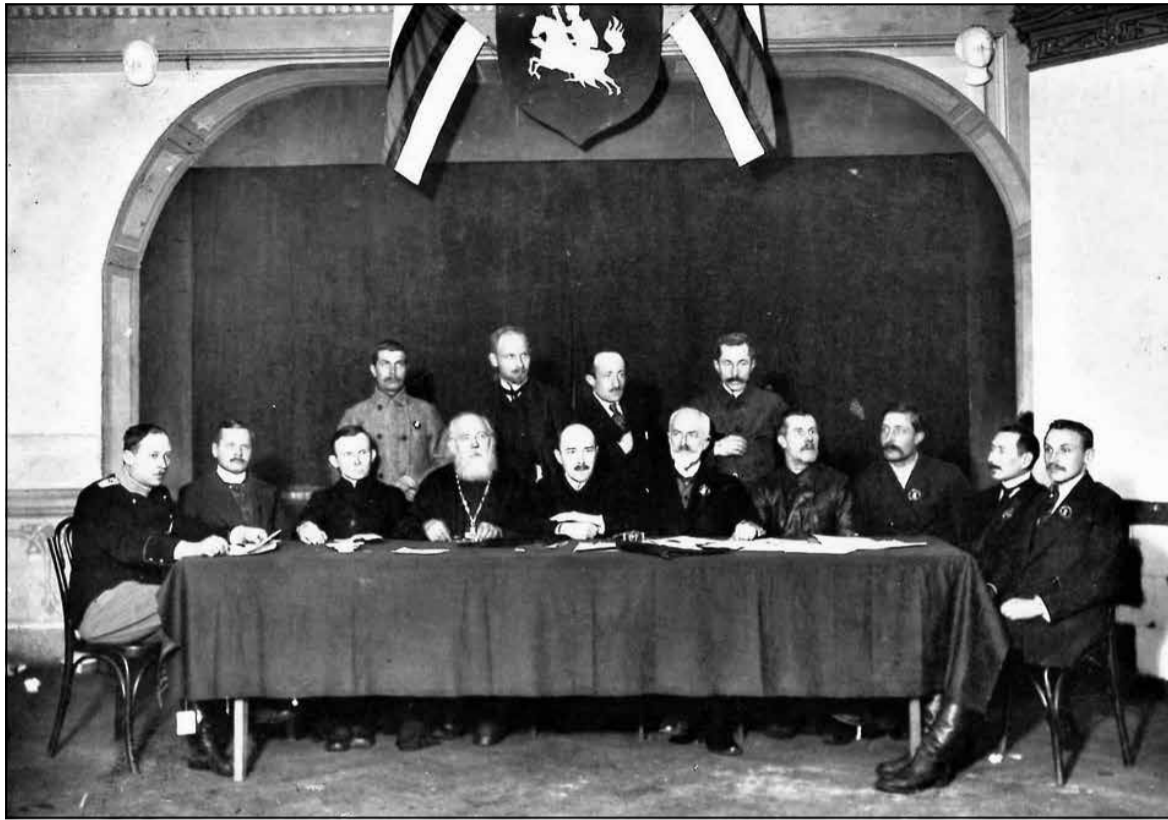
Прэзідыум Рады БНР у Вільні – пад бел-чырвона-белымі сцягамі. Люты 1918 г. (Нацыянальны гістарычны музей Беларусі)

— Ці моцна беларускія калабаранцкія фарміраванні забрудзілі нацыянальную сімваліку?