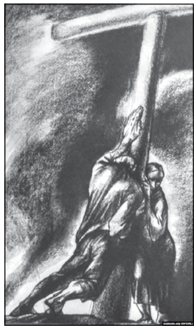
Ілюстрацыя Арлена Кашкурэвіча да кнігі Васіля Быкава «Знак бяды»

Да жніўня 2020 года большасць беларусаў верыла ў сілу закона. Яшчэ ў чэрвені адзін з кандыдатаў у прэзідэнты, адказваючы на пытанне, што будзе, калі яго арыштуюць, са шчырым (ці добра ўдаваным)